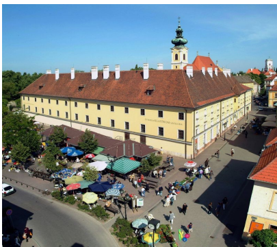
Hotel Klastrom in Győr

Weiter führt die Strecke durch kleine ungarische Bauerndörfer. Diese reizvolle und idyllische Landschaft der "kleinen Schüttinsel" wird uns verzaubern: Die Radetappe führt durch ein ehemaliges Sumpfgebiet mit sanften Ebenen und reizvollen Dörfern bis nach Győr, ca. 65 km.